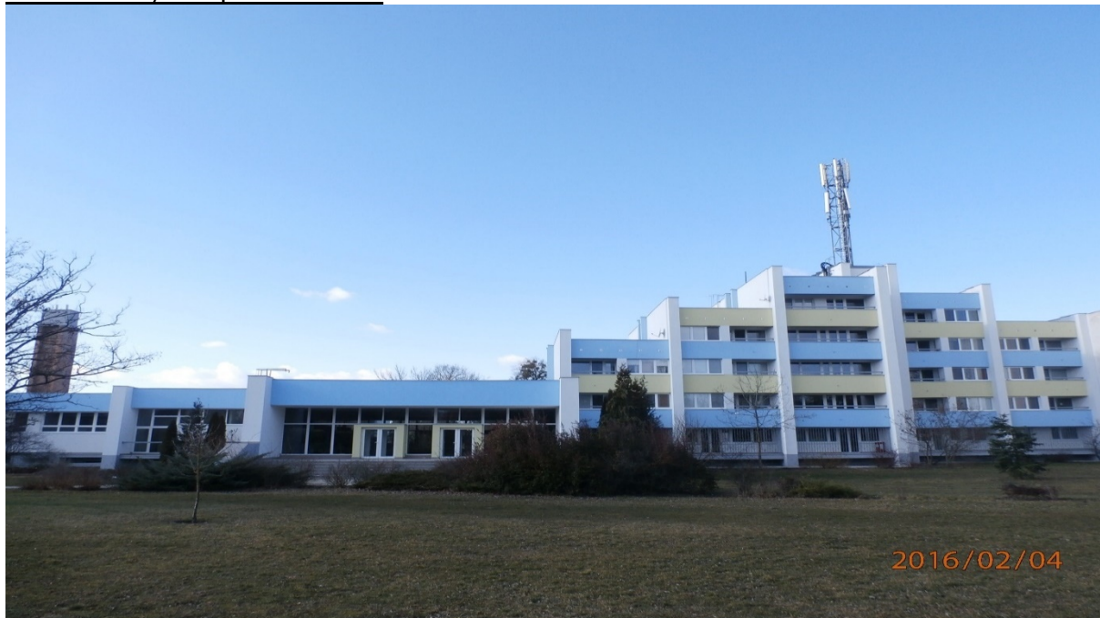
budova školského internátu – súpisné číslo 54